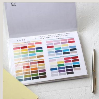
フォーシーズンにおとしこむとSummer SpringやWinterにも、似合う色あり