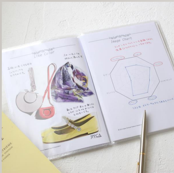
小物のアドバイスやイメージチャート