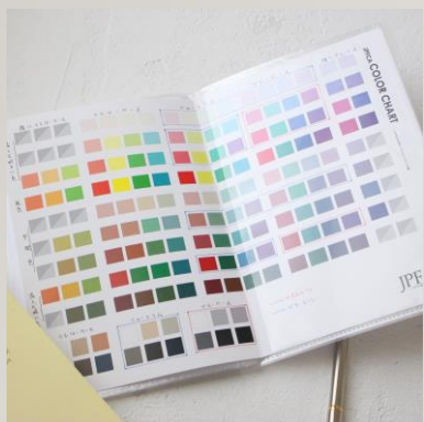
私のベストトーンは「ブルーベース」 ベタートーンは「ニュートラル」