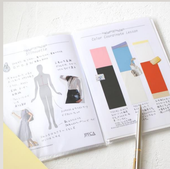
シルエットやカラーコーディネート