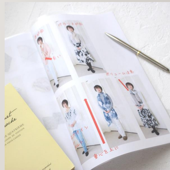
お買い物同行のため準備した写真にコメントもいただきました♡